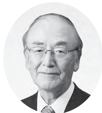
日本商工会議所 会頭 三 村 昭 夫